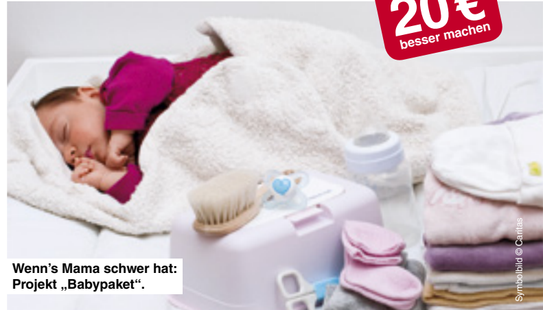
Wenn's Mama schwer hat: Projekt „Babypaket“.