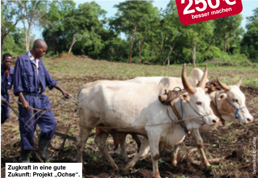
Zugkraft in eine gute Zukunft: Projekt „Ochse“.

Mit einem Ochsesgespann können größere Ackerflächen bestellt, bessere Erträge erzielt und damit medizinische Versorgung und Schulen bezahlt werden.