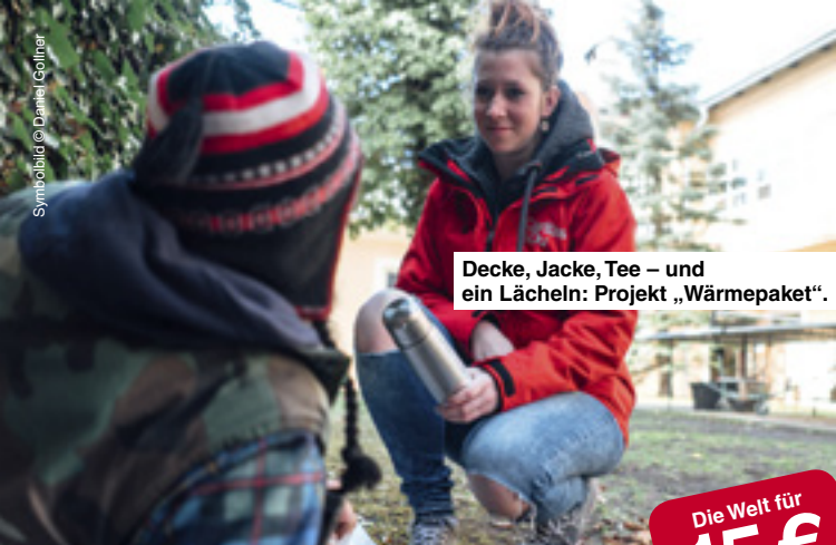
Decke, Jacke, Tee – und ein Lächeln: Projekt „Wärmepaket“.