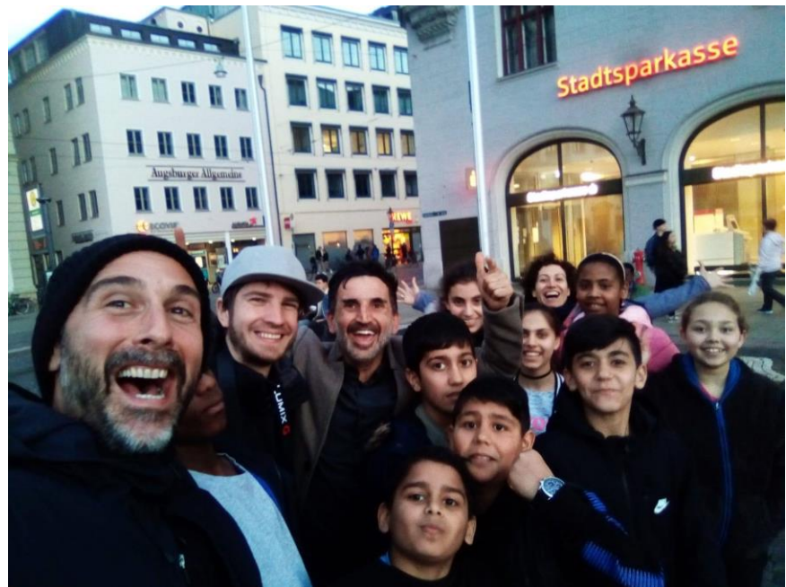
SIQ+Tor.Chance in Augsburg

Viel Spaß beim Lesen wünscht das SIQ+ Team!