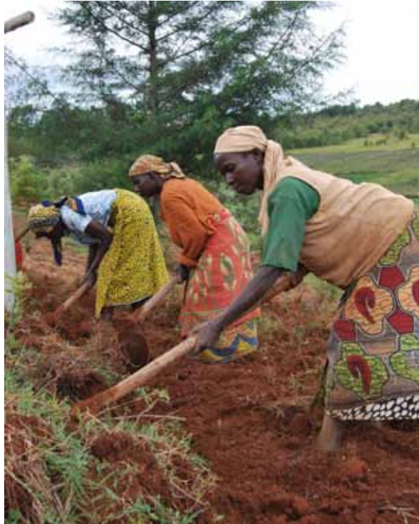
Eine Ausbildung als Schritt in die Selbstständigkeit: Die Caritas fördert Frauen im Südsudan. – Bild rechts: Projekte für nachhaltige Landwirtschaft.