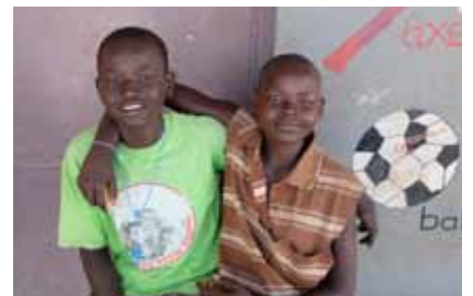
Schule: Lernen für eine gute Zukunft. – Bild darunter: Street children – von der Straße in die Schule.

Teller. Hinzu kommen die Auswirkungen der schlechten Ernte vom Vorjahr, unregelmäßiger Regen und die vielen Flüchtlinge innerhalb des Landes. So ist die Ernährung von mehr als der Hälfte der Bevölkerung nach Angaben der Regierung nicht gesichert.