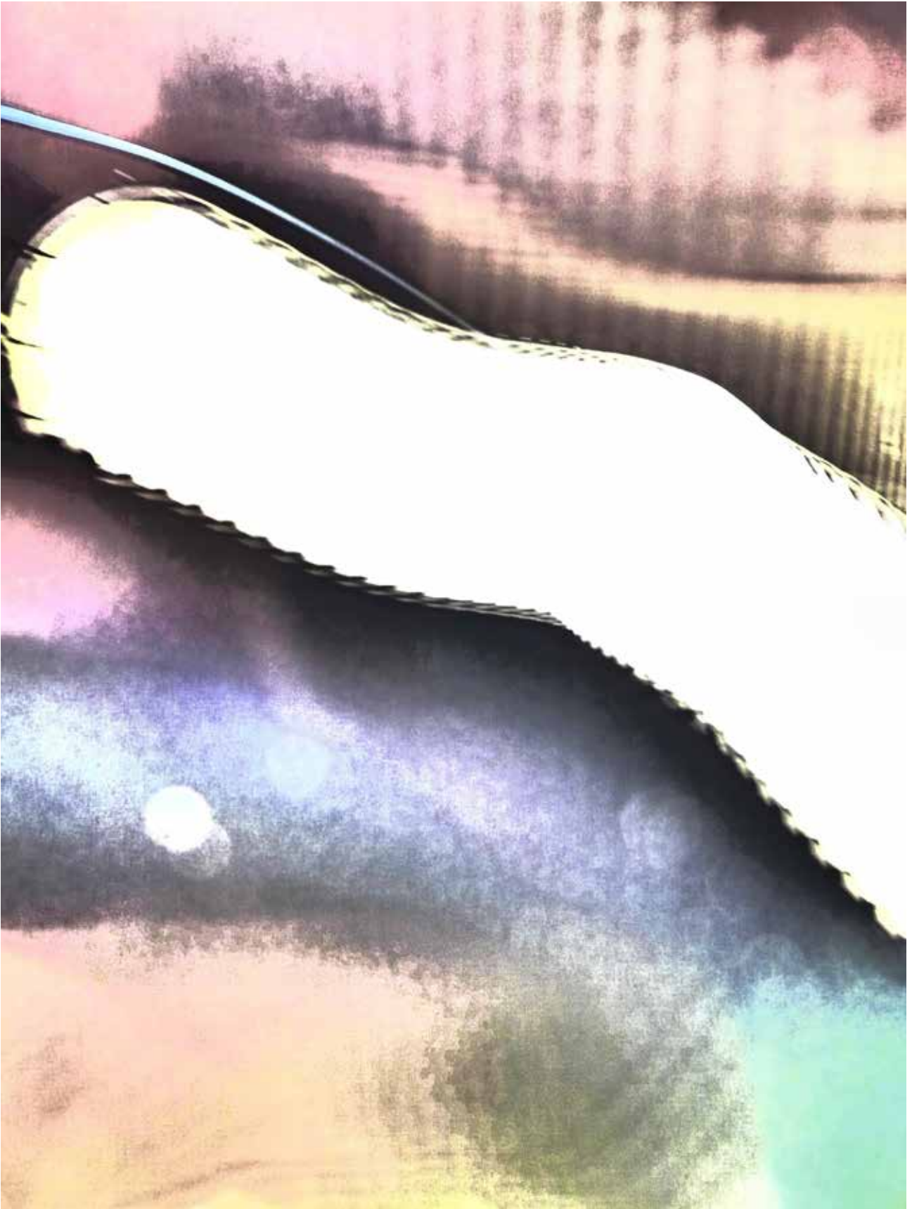
Elementar 2 - von Nicole E.