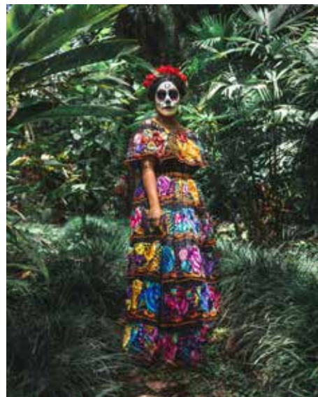
Eine Frau in der Tracht zum Día de los muertos

https://www.spektrum.de/news/rituale-wo-trauernde-laecheln/1425172 https://www.die-goetter.de/trauerrituale-in-anderen-kulturen-und-bei-uns http://www.familie-und-tod.de/tod-in-verschiedenen-kulturen/ https://trauerdrucksachen.info/blog/tod-in-anderen-kulturen-westafrika/ https://www.wissen.de/fest-feiertage/tod-und-bestattung-anderen-kulturen-2013-12-11 https://www.deutschlandfunk.de/der-tod-ist-der-wichtigste-tag-im-leben-100.html https://trauer-now.de/magazin/trauerrituale/so-trauert-die-welt/ https://www.planet-wissen.de/gesellschaft/tod_und_trauer/sterben/pwielebennachdem-tod100.html https://www.benu.at/